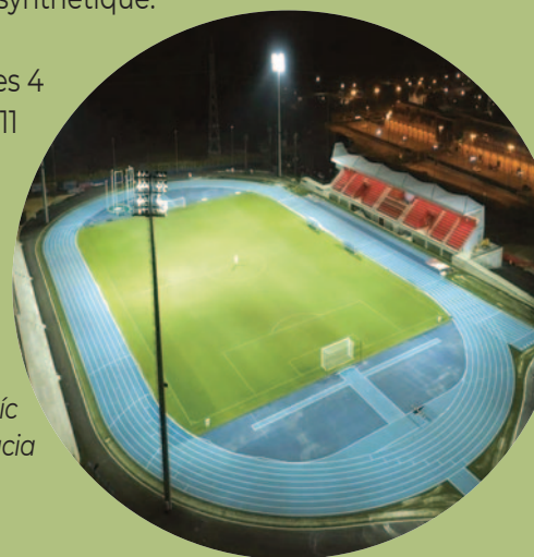
Estadi Olímpic Camilo - La Nucia

Les grandes finales des 4 tournois de football à 11 auront lieu à l'Estadio Municipal Guillermo Amor le 16 Mai 2026.