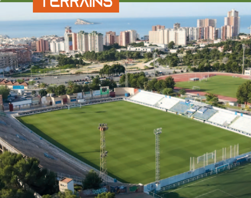
Estadio Municipal Guillermo Amor - Benidorm

Les rencontres du 22 e Mundiavocat se dérouleront dans les municipalités de Benidorm (6 terrains), la Nucia (3 terrains) et des communes avoisinantes : Altea , La Vila Joiosa , l'Alfàs del Pi et L'Albir .