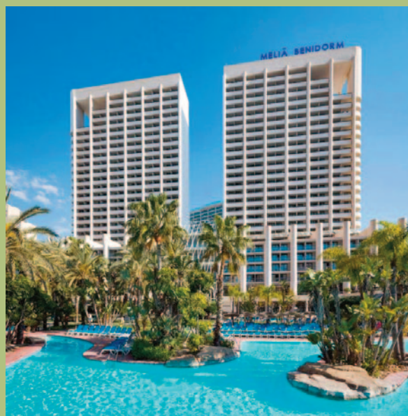
▲ Meliá Benidorm